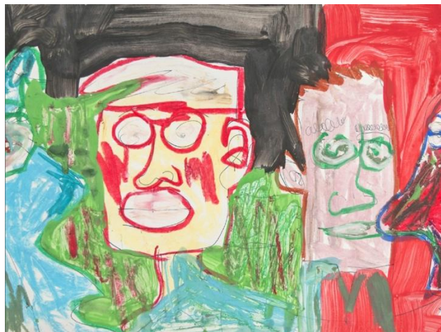
Jean-François Gasse, non titré, 2015 © La Collection Les Impatients

C'est ainsi que durant cette journée exceptionnelle, dédiée à cette revue francophone d'exception dans l'univers anglophone des publications savantes qu'est Santé mentale au Québec , ont été honorés les auteurs, évaluateurs, pairs, réviseurs et autres personnes concernées de près ou de loin par la santé mentale, sans lesquelles il ne lui eut pas été possible de devenir une vigoureuse cinquantenaire.